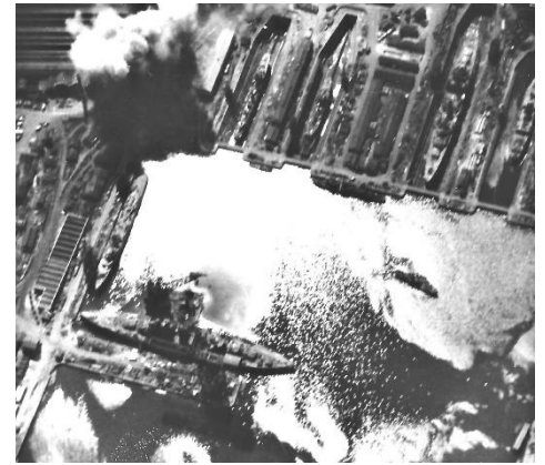
Bild: Bombardierung des Hafens in Plymouth / England am 24.09.1940