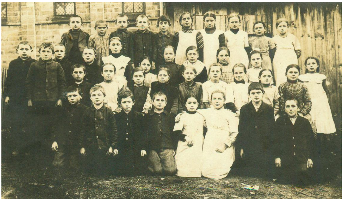
Tennenbronner Mädchen und Buben vor der alten katholischen Kirche Wer erkennt die Gesichter?

Heute stellen wir ein Foto vor, das uns Fam. Herbert Waller zur Verfügung gestellt hat. Es zeigt eine Gruppe von Buben und Mädchen, die sich zum Gruppen-Foto postiert haben. Entstehungsjahr unbekannt. Wer kann die abgebildeten Jugendlichen (oder auch nur den einen oder anderen davon) identifizieren? In welchem Jahr, bei welcher Gelegenheit wurde dieses Bild gemacht? Wer etwas weiß, melde sich bitte bei einer der unten genannten Personen. Wir werden in einer der nächsten Ausgaben des Tennenbronner Anzeigers die gewonnenen Erkenntnisse veröffentlichen.